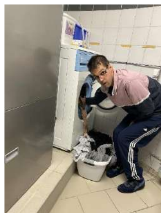
S'occuper de son linge