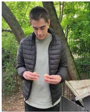
Une sortie à Aix-les-Bains pour les 1 er et 3 ème étage