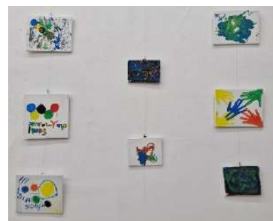
Quelques créations des résidents du Vallon exposées au mois de l'accessibilité