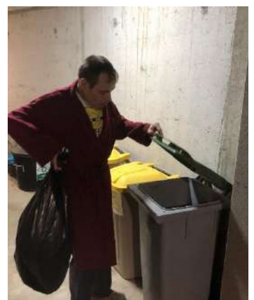
Descendre les poubelles