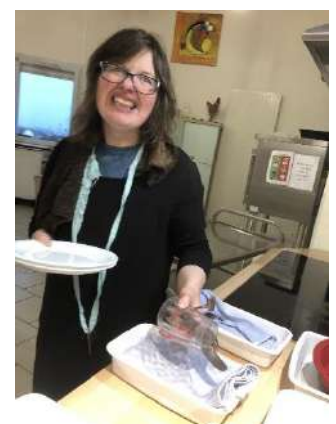
Préparer les couverts