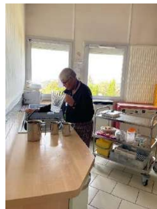
Remplir les pots d'eau

Bienvenue sur la maison DYKE, ici vivent 7 personnes en résidence permanente ainsi qu'une personne reçue en accueil temporaire. Chacun participe à la vie collective et prend soin des lieux. A tour de rôle pour certaines tâches, ou sur base du volontariat pour d'autre, chaque résident réalise des tâches du quotidien avec ou sans guidance, avec ou sans support.